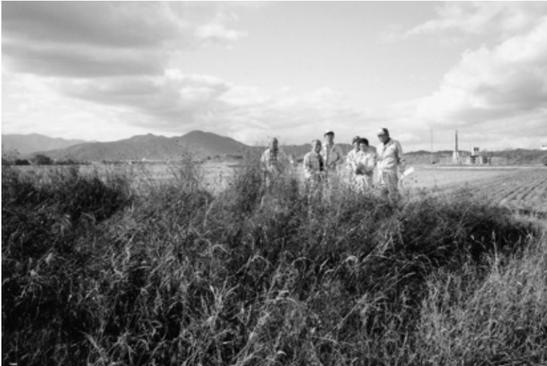
遊休農地のパトロールを行う亀岡市農業委員会