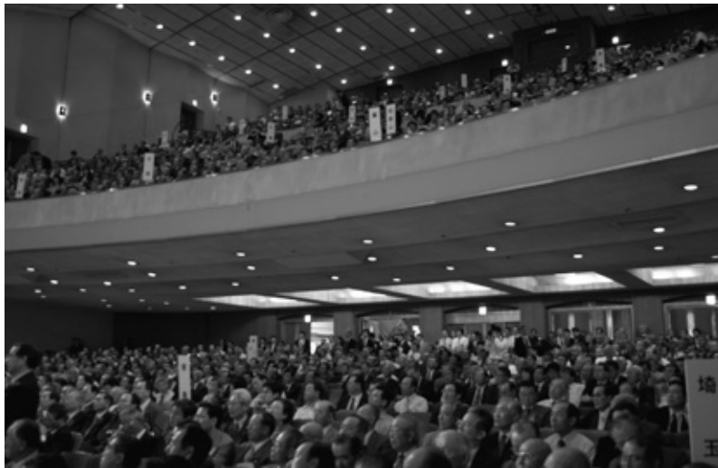
全国から約2千人の農業委員会会長が参加した

発行 京都府農業会議 〒602-8054 京都市上京区出水通油小路東入丁子風呂町104-2 京都府庁西別館内 TEL: 075 (441) 3660 e-mail: k_noukai@agr-k.or.jp