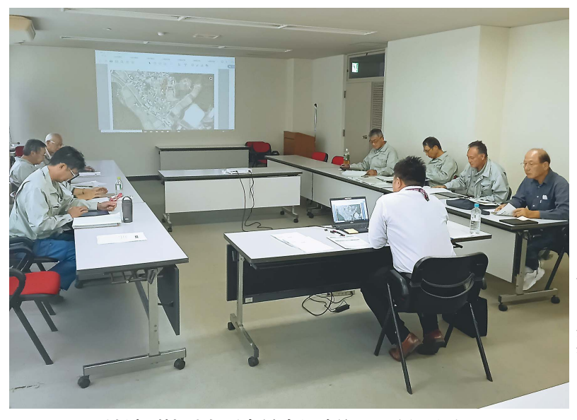
地域別検討会(南丹市日吉町、10月11日)

南丹市農業委員会は、今年も旧町(園部・美山・日吉・八木)ごとに農地利用状況調査(農地パトロール)の地域別検討会を開催し、各地区の委員が1筆ごとに遊休農地や非農地の判定を行う取り組みを進めている。